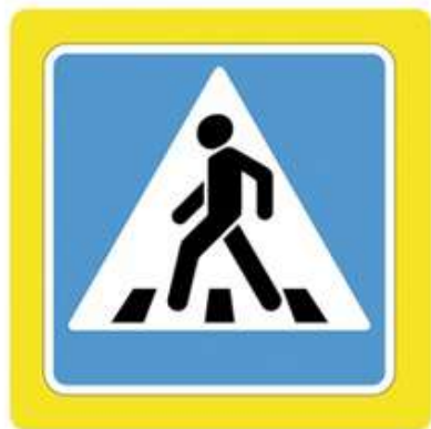
Наземный пешеходный переход