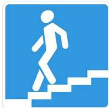
Подземный пешеходный переход