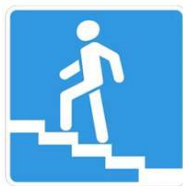
Надземный пешеходный переход